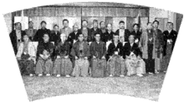
きもの議会にて（後列左2番目）