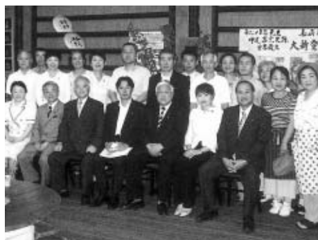
長崎県波佐見町で町づくりに頑張る皆様と

一日中子どもと過ごし「可愛い！」と思う反面、トイレに行くのもままならない毎日。ゆっくりお風呂に入りたい、一晩ぐっすり眠りたい、一人で過ごす時間がほしいと思いながら、「子育て中なのだから我慢しなければ」とささやく声。こうした思いがつのり苛立ちやストレスを抱えてしまいます。そんな時気軽に思いを話せる“誰か”、夫、両親、友達、いつも声をかけてくれる近所のおばさんなどの存在があり、ありがたく、何気ないおしゃべりの中の一言や、少し先輩のお母さんの体験談が心を軽くしたり、少しの手助けに元気ができます。そして改めてわが子を見たとき愛しさが倍増するよう感じることでしょう。母親の気持ちがゆったりとしている時、子どもはご機嫌の笑顔を見せることが多いように思います。逆にいらいらしたり疲れてくるとついつい子どもを叱ったり、大きな声で接したり、子どもの呼びかけに応えることができなくなってしまいます。すると子どもは不安な気持ちになるでしょう。「一人目の子どもは、こんなに可愛いと感じなかったような気がする。」と話されるお母さん。生まれたばかりの赤ちゃんの“お母さん”も生まれたて。責任と緊張で“どうしよう”と戸惑うことが多くゆったりと接することできなかつたのでしょね。