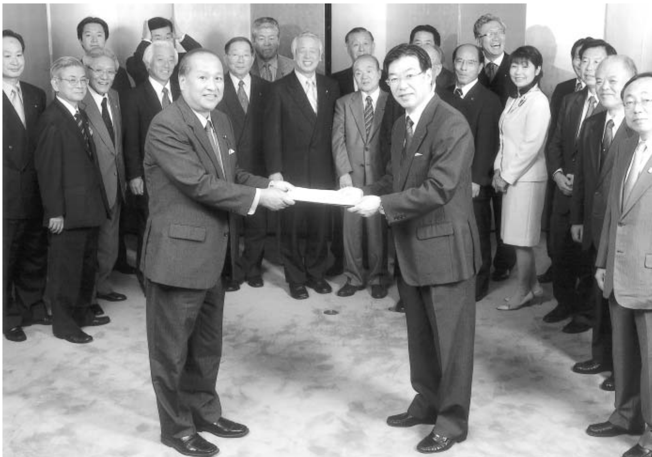
平成19年度の京都府予算に対する要望