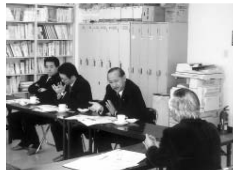
帯広ケアセンターで精神障害者の自立支援について質問