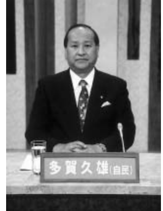
KBS京都テレビで児童虐待について語る

支援センターが“悩み事相談の場”という認識が先に立っているように感じます。そうではなく、“お母さんの息抜きの場”“子ども達が安心して遊べる場”の役目のほうが大きいと思います。その役割を少しでも果たすことで、お母さんの気持ちにゆとりを持っていただけたらと思っています。