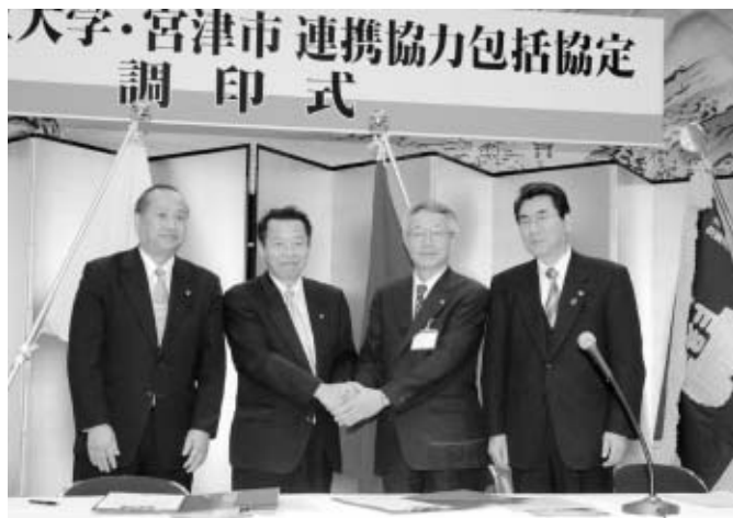
府立大学・宮津市連携協力包括協定調印式

質問に汗たらたらでした。私の先輩議員に聞くと、自分も小学生の時、修学旅行で見学に来たとのことでありました。もっとこうしたことが増えれば、若者も政治に関心を持つのもかもしれませんね。また、大江山登山マラソンでは、今年はどんなゲストランナーと会えるかなと楽しみにしています。