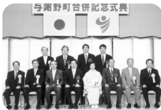
与謝野町合併記念式典