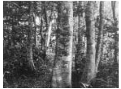
上世屋のブナ林(上世屋側にはまっすぐなブナが多く見られる)

宮津市の上世屋から大宮町の五十河にかけてのブナ林115haが、平成14年3月26日、丹後上世屋内山京都府自然環境保全地域として指定されました。ブナ林は、標高450メートル付近の低い標高から分布が見られるほか、「あがりこ」と呼ばれる巨大なブナの変木が点在しているなど、学術的価値の高い自然で、地域住民の暮らしや営みとかかわりを持ちながら守られてきた、将来の府民に伝えていくべき貴重な財産であり、天然シャクナゲが群生する京北町の片波川源流域に次ぐ二番目の指定となります。