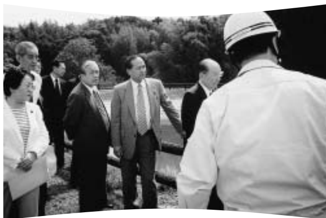
平成13年9月18日 防災水資源 亀岡赤態大池