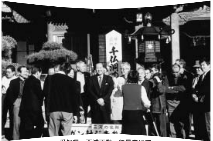
愛知県 西浦不動 無量寺にて 後援会の皆様、何かとお世話になりました。