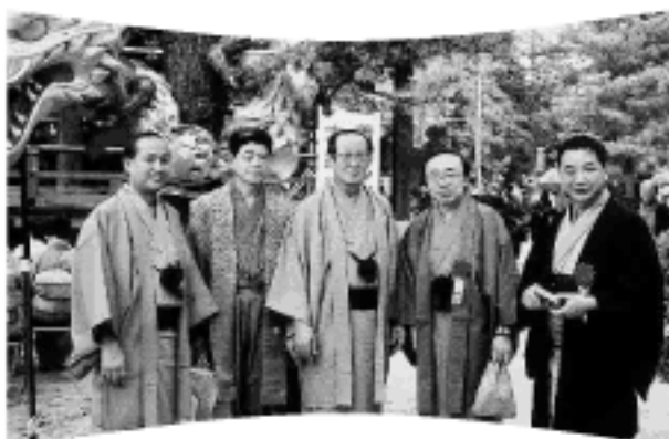
平成12年10月15日 きものまつり会場にて (智恵寺)